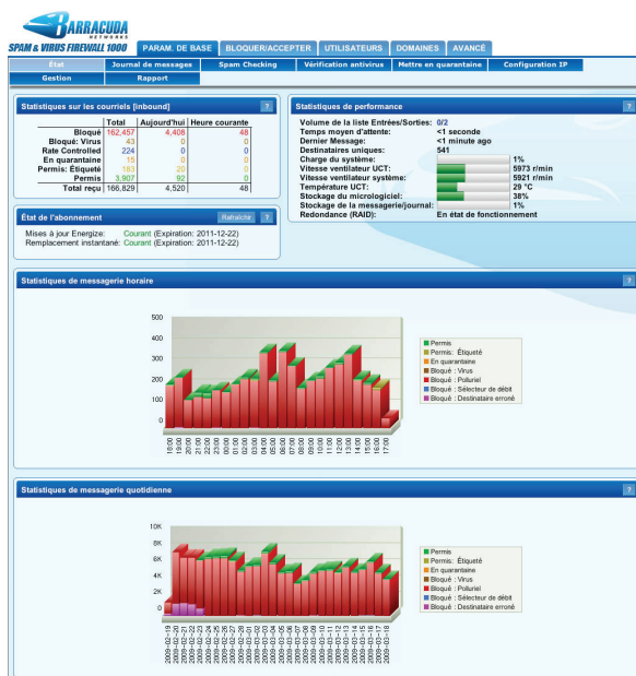
Le Barracuda Spam & Virus Firewall filtre tout le courriel et affiche le nombre de messages électroniques reçus avec les statistiques sur les méthodes de traitement utilisées.

L'installation du Barracuda Spam & Virus Firewall est simple et ne requiert aucune installation de logiciel ni modification de réseau. Les mises à jour (Barracuda Energize Updates) sont livrées automatiquement par Barracuda Central, un centre de technologie avancé où les ingénieurs travaillent en permanence dans le but d'offrir les méthodes les plus efficaces pour combattre les variétés de virus et de courriers indésirables en évolution continue. Les Energize Updates sont distribuées toutes les heures et offrent ainsi une protection continue contre les toutes dernières menaces notamment les définitions de courrier indésirable, de virus et les mises à jour sur la sécurité les plus récentes.